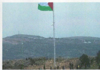
מבצר חשמונאי (שומרים על הנצח)