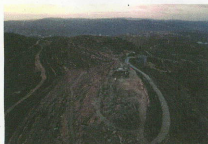
מבט מלמעלה: המבצר החשמונאי תל ארומה, (צילום: איתמר וייס)

החשמונאים מתהפכים בקברם: "מסגד השאהידים" נבנה על המבצר העתיקה (ynet.co.il)