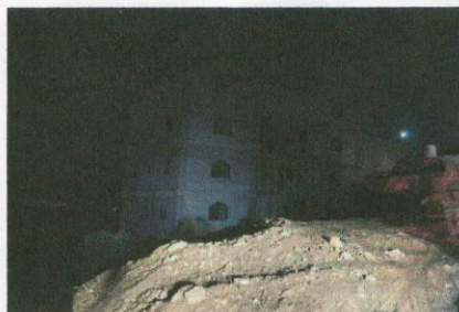
"מסגד השאהידים" 6 קומות שנבנו על שרידי האתר הארכאולוגי החשמונאי, (צילום: אסף קמר)