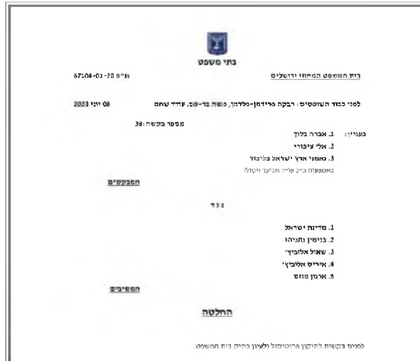
Figure 2. The latest decision in the “Decisions Docket” tab in Net-HaMishpat – public access system (Downloaded on June 11, 2020).