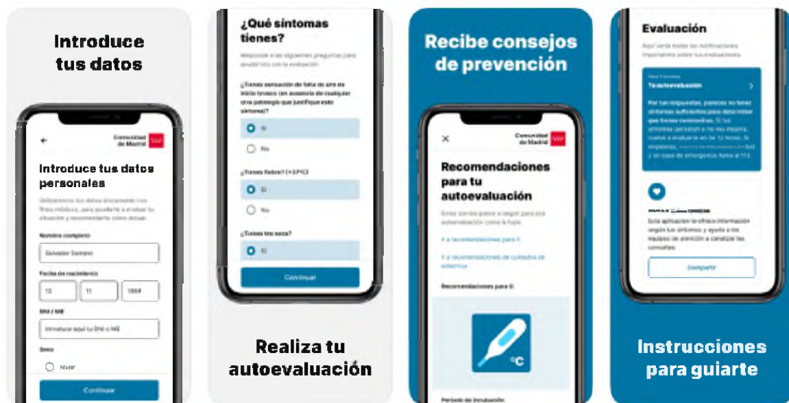
עמודי משתמש לדוגמה מאפליקציית CoronaMadrid