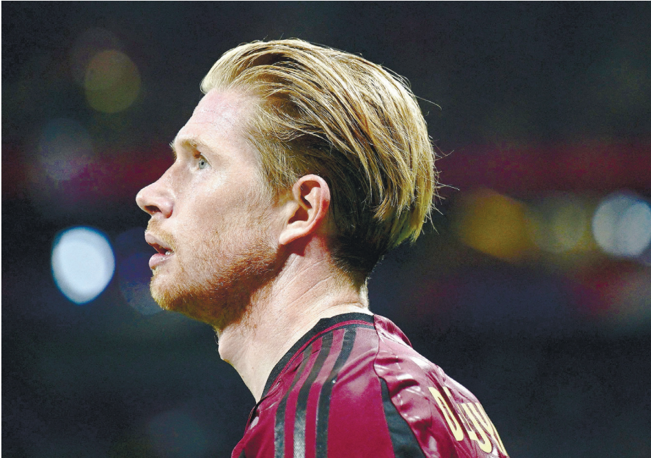
דה ברוינה בהפסד נגד צרפת, בשבוע שעבר. ״לא כולם נותנים הכל״, אמר אחרי המשחק

קווין דה ברוינה מעולם לא התבייש לרבר בפתיחות על הבעיות של נבחרתו המאכזבת. לא בטוח שהוא לא אחת מהן