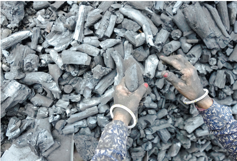
מימן פחם במפעל באחמדבאד, 2022. התעשייה מעסיקה מיליוני עובדים

טון. "בעוד שבשבתאי ובצדק כמ' עט כל המסה היא מימן והליום", אמר מלמדו, "באורנוס ובנפטון שיעור היסודות האלה נע בין 15 ל-25 אחוז. הסברה העדכנית של' נו היא שיתר החומרים הם סל' עים וקרחים, כאשר מתאן הוא המלמד סבור כי אם תאומת ההצעה החדשה, יהיה זה ש' נוי פרדיגמה באשר לאופן שבו אנו מגדירים את אורנוס ונפטון. לדבריו, ההרכב הכימי הוא פרט