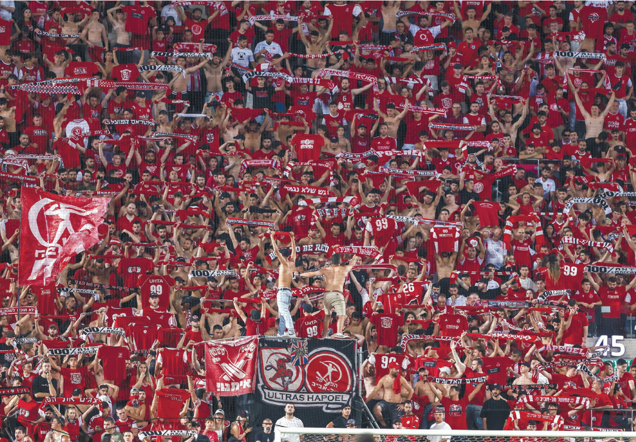
אוהדי הפועל תל אביב. שריקות בזו לשחקן ערבי אינן דבר נדיר בכדורגל הישראלי, אבל ביצע הזה חן חסרות תקדים

אחרי 11 חודשי מלחמה, אפילו אוהדי הפועל תל אביב ונחו את הערכים שלהם וביצעו ליון נסאר משפט שדה לאומני