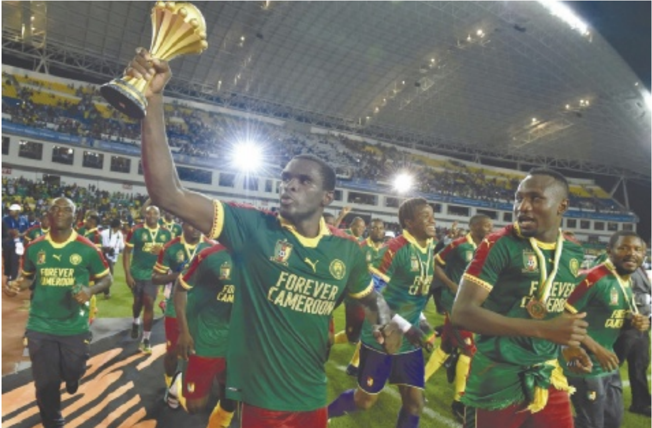
החגיגות של קמרון, אתמול. האיצטדיון עף בדקה ה־88, ולא נחת גם אחר כך