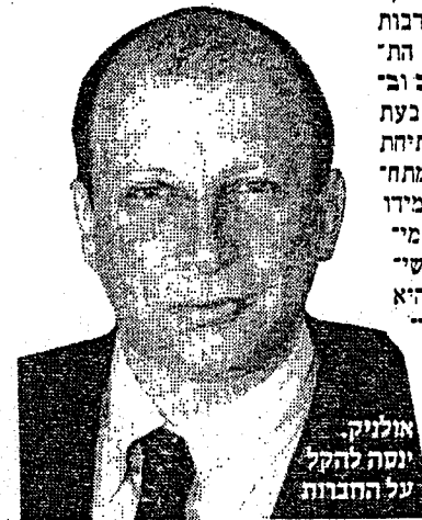
אולניק, יוטה להקל על החברות

"לצנע אפליה בין החברות" משרד התקשורת טען שהערבות נדרשת על מנת שלא תיווצר אפליה בתנאי הרשיון של שלוש החברות. מבזק בינלאומי נמסר בתגובה שברשיון המקורי שלה לא הופיע כל אזכור לערבות זאת בשל היותה חברה ממשלתית שבבעלות בזק. שבבעלות המדינה. גורם בכיר בפי לאפון מסר שלא ידוע לו על דרישה מצד המשרד לערבות בנקאית.