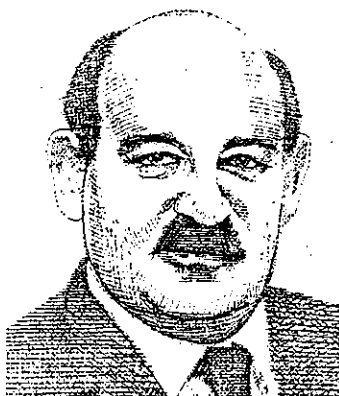
בהן. בבר מסיק לקחים