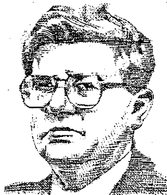
ברק. 4.34 מתוך 5

טים "עו"ד - 4.1: חברות - שיקום ופי רוק - 4.06: שאגת אריה (מושב בנושא אריה דרעי) - 4.05: הייטק קניין רוח גי - 4: בית דין ארצי לעבודה - 4: תכ נון ובנייה - 3.89: רפורמה בבתי המש פט - 3.88: מקרקעי הלאום - 3.78 צווארון לבן מעל החוק - 3.11.