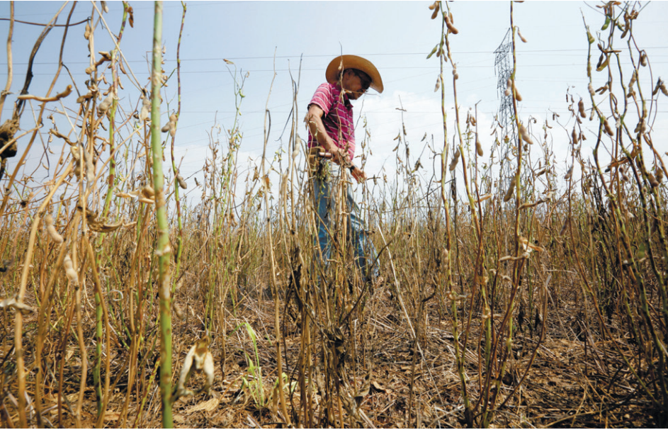
חוות סויה בפרגוואי. חקלאות היא מהתורמים הגדולים להתחממות הגלובלית

לונג אמר שצוותו מקווה להמ־שיך בניסויים עוד חמש שנים. כמו כן הוא מתכנן לצאת לפארוטו רי־קו כדי לבדוק איך השינויים הג־נטיים משפיעים על פולי סויה טרופית. אחד היעדים של צוותו הוא להבטיח שורעים שמפיקים יבולים גדולים יותר יהיו זמינים לחקלאים במדינות מתפתחות.