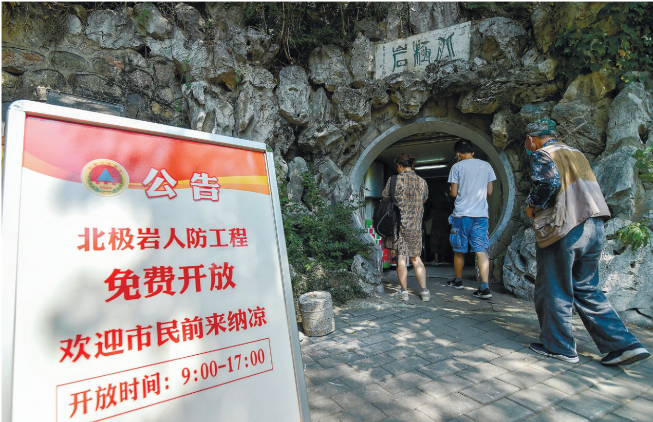
מקלט שהוסב למחסה מפני החום בעיר נאנג'ינג, בחודש שעבר. מפלס היאנגצה ירד באופן חסר תקדים