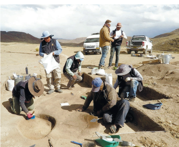
חפירה בקברים בהרי האנדים

בלפר־כהן מציינת כי בכנס, ובספר שהתפרסם בעקבותיו תחת אותו שם, היו חידושים משמעותיים רבים בהכנה של חיי היומיום של הציידים־לק"טים בעבר החוק. המקרים שהוצגו בכנס הביאו לפירוק התפשישה שלפיה המין האנושי מתקדם בתהליך ליניארי. לדברי הארכיאולוגית, לפי ההשקפה ששלטה עד הכנס "הציידים־לקטים היו מסכנים שלא ידעו מאיפה תבוא הארוחה הבאה שלהם, והחקלאות שיפרה את חיים", למעשה, זהו להם אורח חיים, איכות קיום ואריכות־ימים יותר טובים מאשר לכני האדם שבאו אחריהם. "אורח החיים של חקלאות פרימיטיבית הוא הגרוע מבין השלבים בקיום האנושי", מסבירה בלפר־כהן.