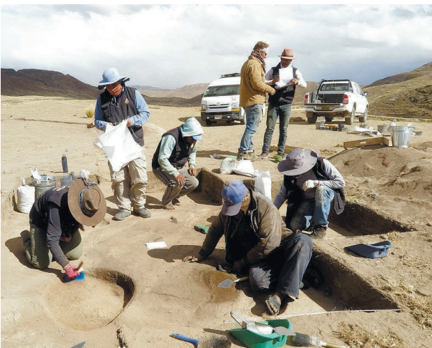
חפירה בקברים בהרי האנדים

בלפר־כהן מציינת כי בכנס, ובספר שהתפרסם בעקבותיו תחת אותו שם, היו חידושים משמעותיים רבים בהכנה של חיי היומיום של הציידים-לק-טים בעבר החוק. המחקרים שהוצגו בכנס הביאו לפירוק התפשישה שלפיה המין האנושי מתקדם בתהליך ליניארי. לדברי הארכיאולוגית, לפי ההשקפה ששלטה עד הכנס "הציידים-לקטים היו מסכנים שלא ידעו מאיפה תבוא הארוחה הבאה שלהם, והחקלאות שיפרה את חיים", למעשה, זהו להם אורח חיים, איכות קיום ואריכות ימים יותר טובים מאשר לכני האדם שבאו אחריהם. "אורח החיים של חקלאות פרימיטיבית הוא הגרוע מבין השלבים בקיום האנושי", מסבירה בלפר־כהן.