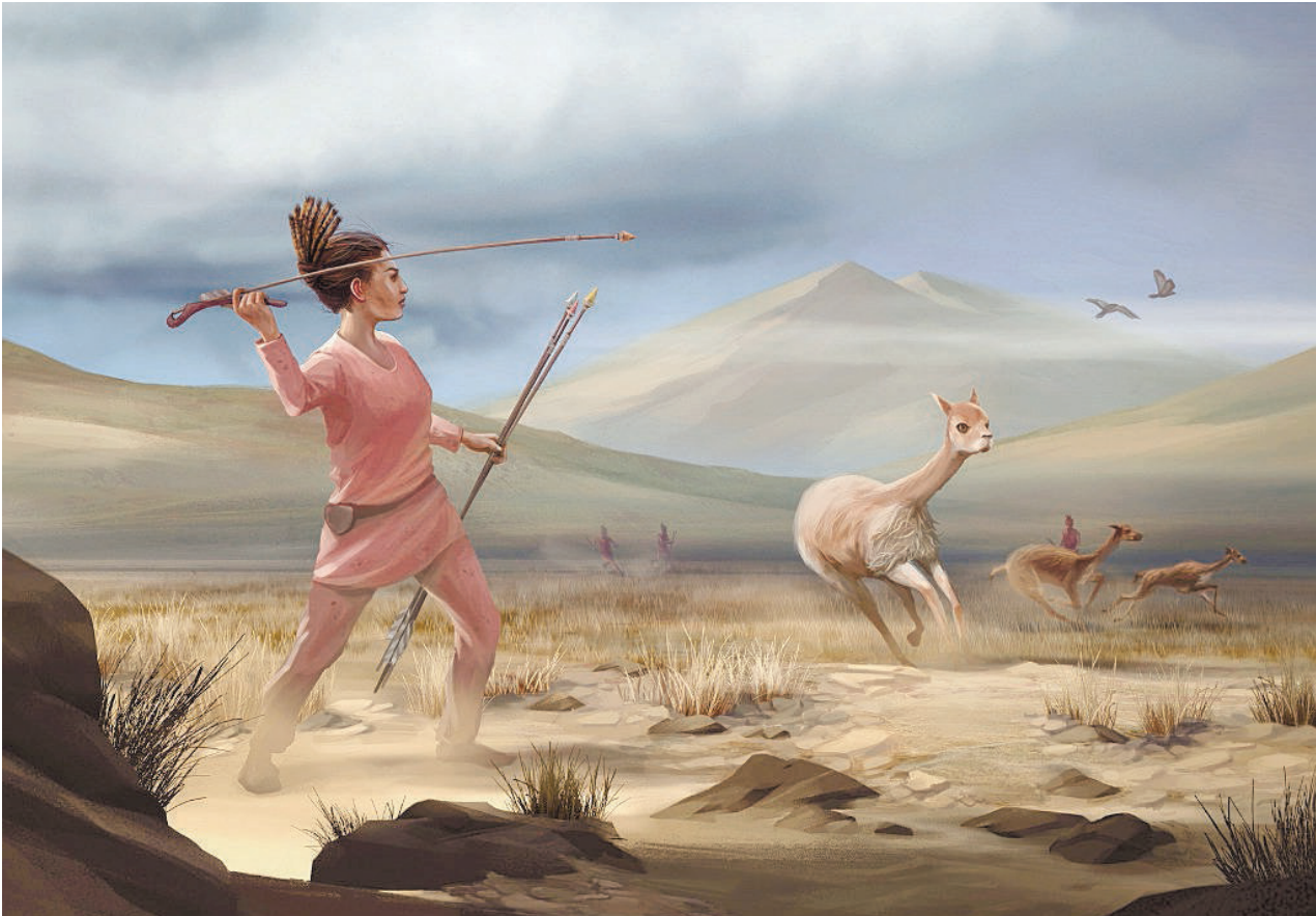
שחזור ציד בהרי האנדים בתקופה הפרה היסטורית

ממצאים מקברים פרה־היסטוריים באמריקה מעידים כי נשים השתתפו בציד לפחות כמו גברים