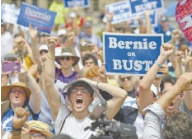
תומכי סנדרס, אתמול בפילדלפיה

בניבאדס הביט על האולם המואר והתאבל על כך שנראה שכל המחאה ששררת בחוץ לא משנה לבכירי המפלגה שנואמים כעת בעד קלינטון. "כנראה היקף השחיתות עוד ייחשף", הוא נאמן, לו את הניצחון. הייתי מעורבת ברישום המצביעים, והיו שלל