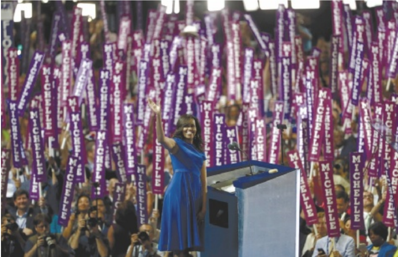
אובמה בוועידה הדמוקרטית בפילדלפיה, שלשום. השרתה רוח של אופטימיות

נאום הגברת הראשונה בוועידה הדמוקרטית נועד לפייס את תומכי סנדרס. כעת נותר לשקם את תדמיתה של קלינטון