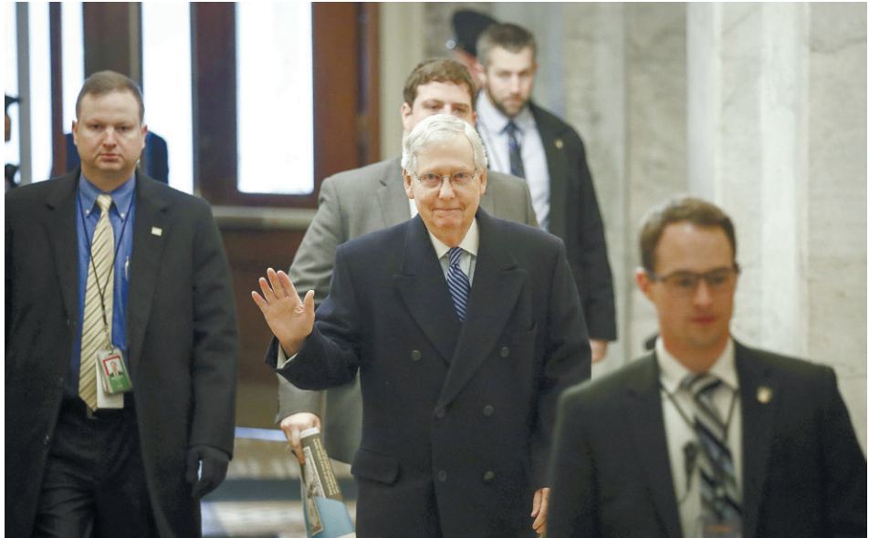
מקונל, מנהיג הרוב הרפובליקאי בסנאט, אתמול בוושינגטון