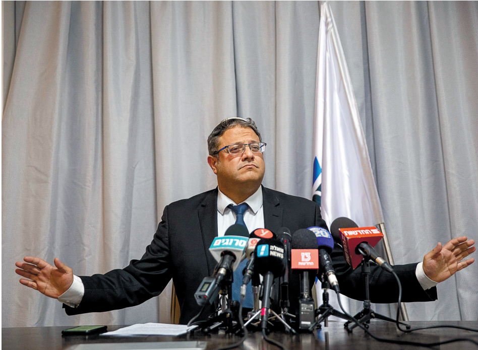
בן גביר במסיבת עיתונאים בירושלים, אתמול. "נקראו את השפתיים שלי", אמר

יו"ר עוצמה יהודית אמר במסיבת עיתונאים כי סיכויי מפלגתו לעבור את אחוז החסימה גבוהים יותר "משיש לנתניהו סיכוי להקים ממשלה"