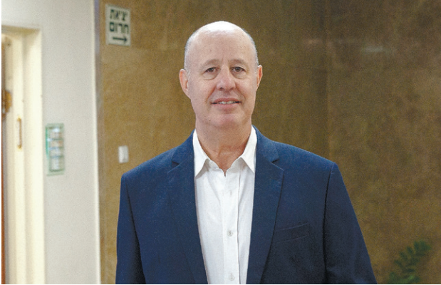
הגנבי בישיבת ממשלה, באוקטובר.

פירוט פוליטי מובנה, שבו מב' טאות מפלגות את עמדותיהן. לה' חלטות הפסילה המתקבלות בה יש משמעות סמלית, משום שב' פועל ההכרעה עוברת מיד לאחר מכן לבג"ץ, שמקיים דיון משפ' טי בראיית השביאוי הצדדים. בק' שת הפסילה של ח"כ בן מנח שור רת התבטאויות שנויות במחל' קת של יובק ברשת. כך, לדבריו,