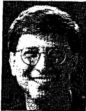
ביל גייטס. "הממשל אשם"

ירידה תלויה בשער מניית מיק' רוסופט עלול לגרום גם לירידת שערים בבירסה של ניריורק, שכן המניה נכללת במדד 30 המניות התעשייתיות של דאו ג'ונס. האנליסטים מזהירים, כי רק