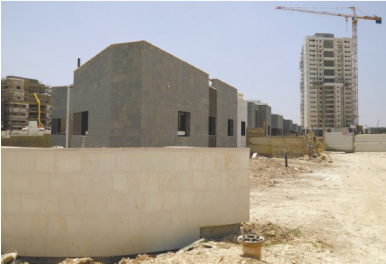
אתר הבנייה בקרית גת שבו נפצע הפועל, אתמול. לפני חצי שנה נפצע במקום פועל נוסף