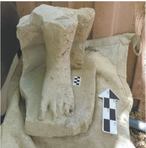
חלקו התחתון של הפסל המתאר ככל הנראה פקיד מצרי בכיר