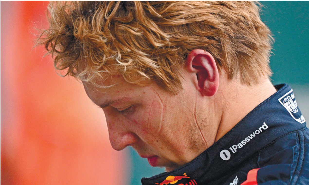
ליאם לוסון במירוץ פורמולה 1 בסין, בשבוע שעבר. להיות נהג רד בול הפך למשימה הקשה ביותר בפורמולה 1

ליאם לוסון החל את עונת 2025 בפורמולה 1 לצד האלוף ורסטאפן, אך כשל בשני המירוצים הראשונים והודה. עכשיו מצפה לו משימה קשה במיוחד: לטפס בחזרה דרך המכונית של קבוצת הבת