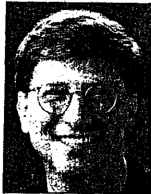
ביל גייטס. "הממשל אשם"

רוסופט עברה על חוקי המונופול של ארה"ב ויצג שורה של עונשים נגד ענקית התוכנה, ביניהם אפס רות לפיצול החברה. מיקרוסופט הר ריעה כבר כי תערער על כל סנק ציה שתוטל עליה. כשלו השויות עוד מתח רב בשוקי הנספים בעולם ובעיקר בארה"ב, לקראת חידוש המסחר הבורס בוול סטריט. רוב האנליסטים סבורים כי פיצוץ הדיונים יביא ל ירדת שעה של מניית החברה וכ עקבותיה לירידת שערים בבורס נאסדק כולה. ירידה תלולה בשער מניית מיק רוסופט עלול לגרום גם לירידת שערים בבירסה של ניויורק, שכן המניה נכילת במדד 30 המניות התעשייתיות של ראו ג'ונס. האנליסטים מזכירים, כי רק