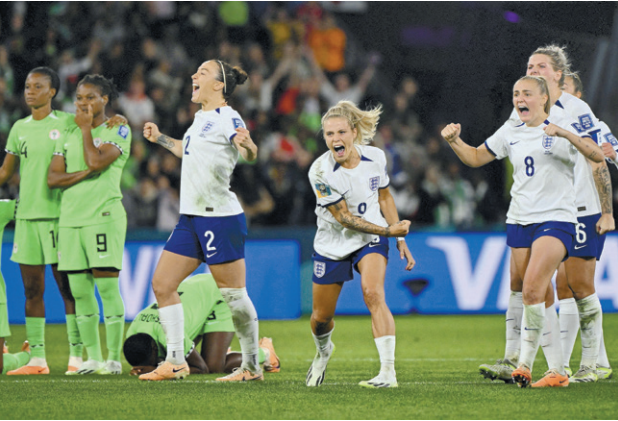
האנגליות חוגגות מול ניגריה, אתמול

היריבות כבר מחכות פרניל הארדר, קפטנית דנמרק: "שיחקנו ממש טוב, ואז אוסטרליה כבשה. זה היה מעצבן"