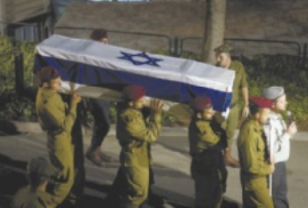
לוויה צבאית בספטמבר. כניסה למערון התגומולים