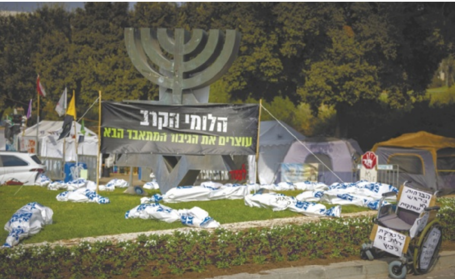
מאהל הלומי הקרב מחוץ לכנסת, בחודש שעבר. בקרב חיילים, שיעור אלה שחשים כי הם זקוקים לסיוע נפשי מבעל מקצוע גבוה מהשיעור הכללי

החישוב אינו כולל את הרוגי המלחמה. לפי דו"ח של קופ"ח מכבי: כשליש מהישראלים מעידים שהם זקוקים לסיוע נפשי