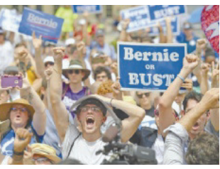
תומכי סנדרס, אתמול בפילדלפיה

מבחינת מאות התומכים שהפגינו ליד אולם וולס פארגון, סנדרס הוא בן ערובה שמדקלם מסרים בניגוד לרצונו