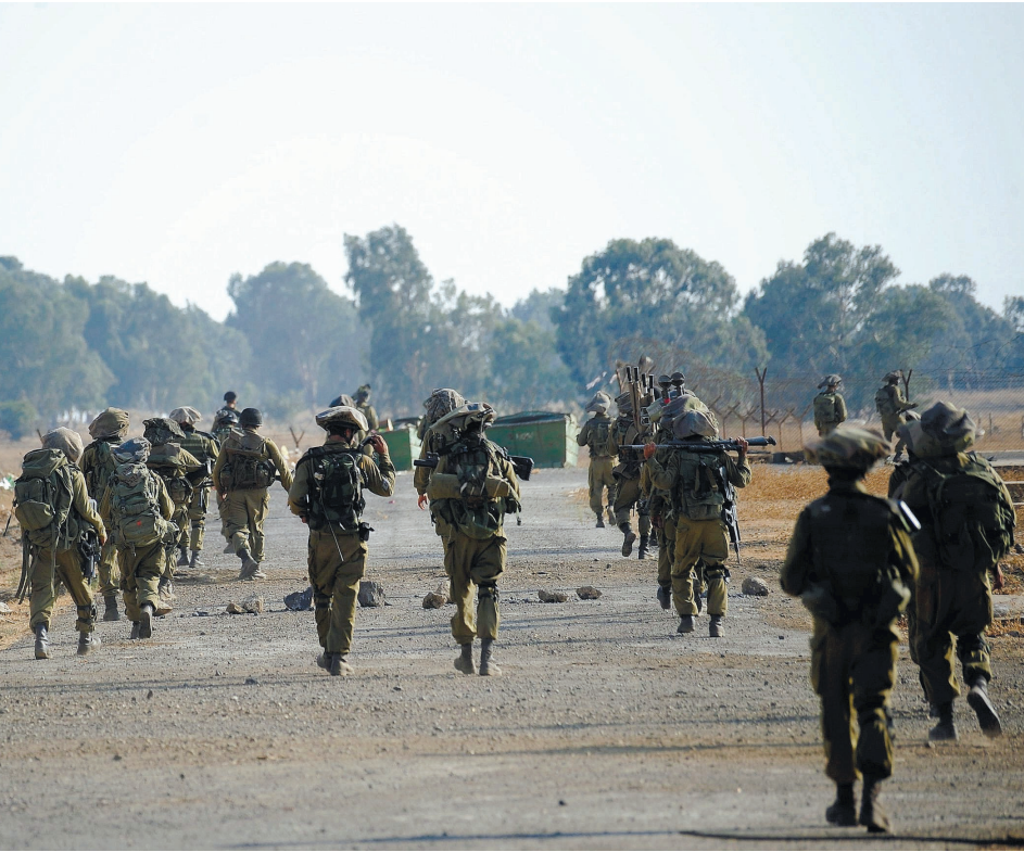
חיילי גולני בצפון. מפקד פיקוד צפון קבע כי אליהו יוכל להתמנות לתפקידי מטה בלבד