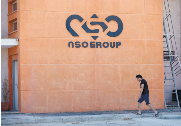
משרדי NSO ביישוב ספיר בערבה

נוסף הכה את העצור באגרזי-פיו ובאמצעות כלי נשק, בזמן שהחייל שהופקד לשמור עליו מעלים עין. הפלסטיני דיווח למצ"ח, וזו פתחה בחקירה. תחילה נעצרו עשרה חשודים, אך רובם שוחררו.