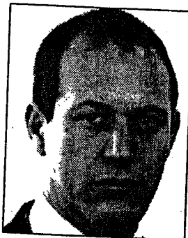
תדמור. מו"מ חד פעמי