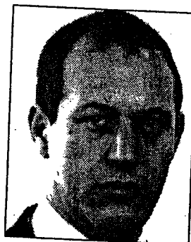
תדמור. מו"מ חד פעמי