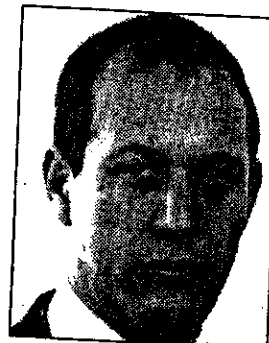
תדמור. מו"מ חד פעמי