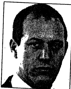
תדמור. מו"מ חד פעמי