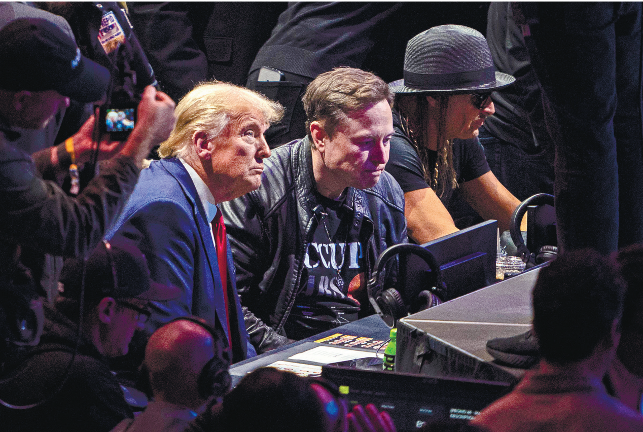
טראמפ ומאסק במדיון סקוור גארדן בניו יורק, לאחר הבחירות. נהנים מהכעס באירופה על המהגרים

ביבשת נאבקים זה עשור בניסיונות החשאיים של רוסיה וסין להשפיע על הפוליטיקה המקומית, אך נשיא ארה"ב הנכנס ושלחיו לא מסתירים את שאיפתם. החשש העיקרי: חיזוק הימין הקיצוני