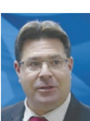
אקוניס

לאתר שספג ביקורת רבה, שטרן הגיב בשעות אחרי צצה" ריים וטען כי הביקורת שמתח על רגב לא היתה סקסיסטית. "אמש, במהלך נאומי במליאת "אמש, גע על איך התק' שטרן, לא כדאי". דבריו ספגו ביקורת מפוליטיקאים מהימין ומהשמאל, שכינו את דבריו מיוזיניים ולא ראויים לדיון בכנסת. השרה רגב אמ' רה אתמול בתגובה כי שטרן "הצטרף לגברים שמכפישם נשים, מחפיצים אותן ומזוללים בכבודן", וקראה ליאיר לפיד, כי היא מפלגתו, להשעות.