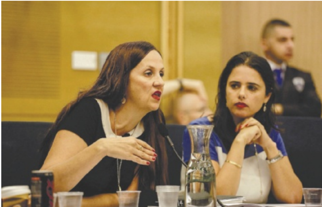
שקד וזילבר בכנסת, ב-2014. שרת המשפטים התלוננה כמה פעמים בעבר על התנהלותה של זילבר

השרה אמרה כי על זילבר לרוץ לכנסת, לאחר שהתבטאה באופן חריג בדיון בכנסת נגד חוק נאמנות בתרבות