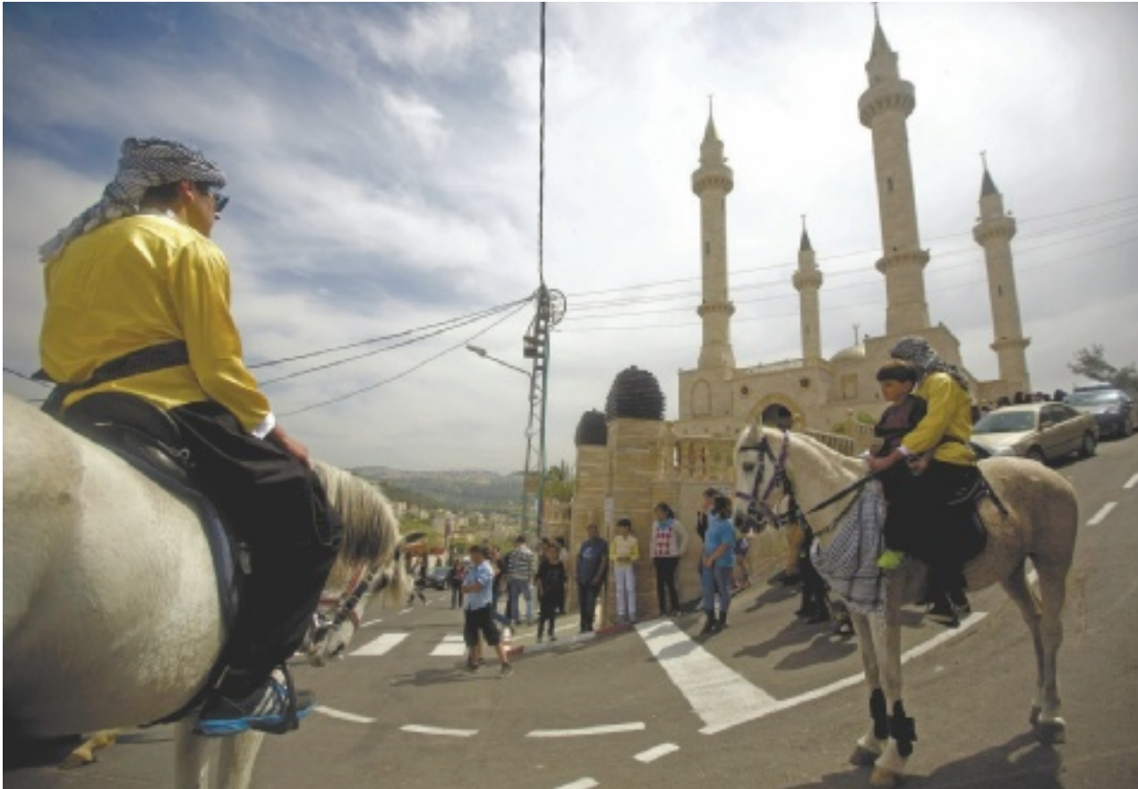
המסגד שהוקם בכפר במימון ממשלת צ'צ'ניה, מארס 2014. תושבי אבו גוש מנתקים עצמם מהציבור הערבי בישראל

תוכנית לבניית 2,400 בתים חדשים צפויה לשלש את אוכלוסיית הכפר, רובם כנראה יירכש על ידי תושבי מזרח יים