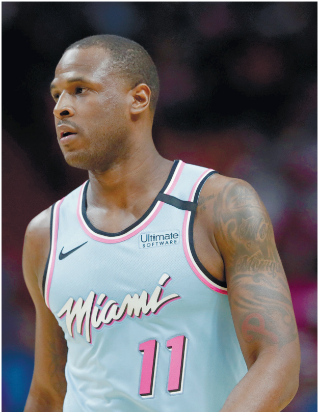
דיון ווייטסרס. הודו כי התנהג כ"ילד דביל"

מצאה לנכון להעמיס על הגב את חיבת הפנדורה שהוא עשוי לה' ביא עמו. בשנה האחרונה, יותר מפעם אחת הניחו שלברון או