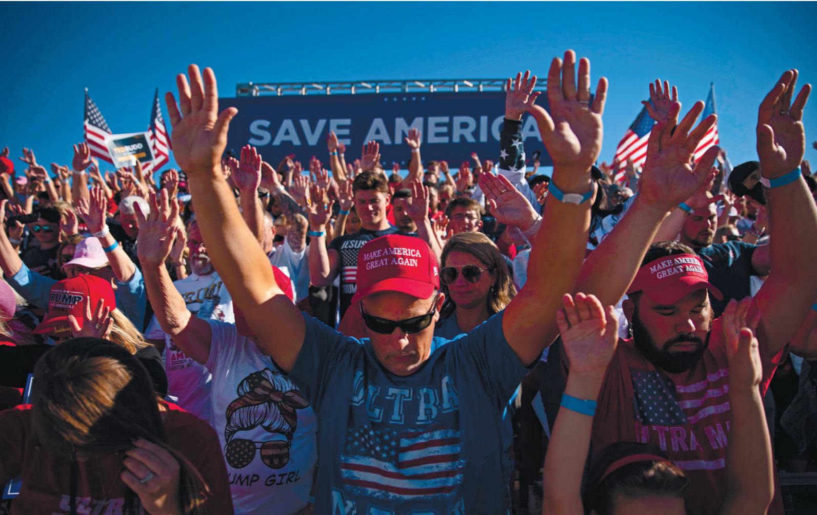
תומכי טראמפ מתפללים בעצרת בחירות, החודש. מסקרים שנערכו באחרונה בארה"ב עולה כי שחיקת הדמוקרטיה אינה תופעה ימנית אלא רווחת

נשיא ארה"ב ביידן, היסטוריונים ואפילו גנרלים מזהירים כי הטראמפיסטים גרמו לאמריקאים לאבד אמון בדמוקרטיה