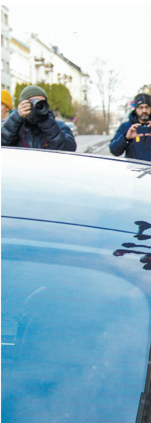
יגלנר באוסלו, בשבוע שעבר. הקשר עם אפשטיין נשאר לבבי גם אחרי שאיש העסקים הורשע בעבירות מין

תמורת ההטבות שהציע לו קיווה אפשטיין שיגלנר יאפשר לו להיפגש עם נשיא רוסיה ול'דימיר פוטין, והעלה את העניין בכמה הודעות ששלח לו. "הרר'סים במצב רוח רע מאוד", כתב יגלנר בספטמבר 2013, והוסיף שהוא מתוסכל מהנציגים הרר'סים בשטרסבורג - מקום מושבה של מועצת אירופה. לאחר מכן הוא הציע תוכניות לבלות באי של אפשטיין בתנים. באותה שנה ניסה אפש'טיין לשכנע את יגלנר שרוסיה מתאימה במיוחד לקדם את הת'חום של מטבעות דיגיטליים. יגל'נד מצידו הציע שאפשטיין יסביר זאת בעצמו לנשיא רוסיה. "היי