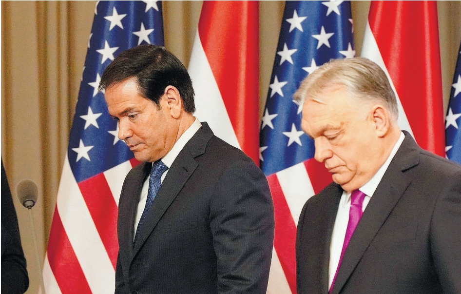
אורבן ורוביו בבודפשט, אתמול. השר הבריטי לחזק את רה"מ אם יקרוס

לדבריו הנהגת רה"מ הנוכחי חיונית לצורכי ארה"ב, ונראה שהוא התנה בהמשך כהונתו את "עידן הזהב" ביחסי המדינות