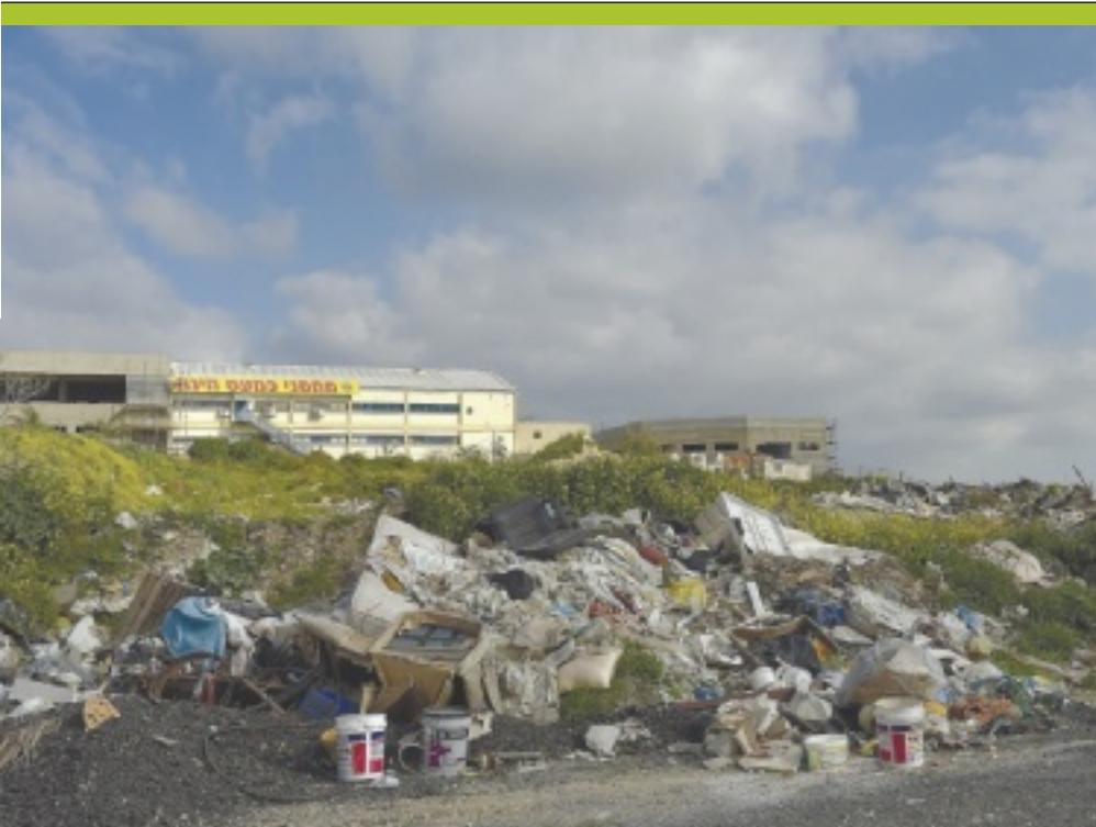
תעשיה בדליית אל־כרמל

שהחתימו עליהם את היוזמים, בשל הוראה ממועצת מקרקעי ישראל, שפעלה בשיטת "שגר ושכח", או למעשה "מכור ושכח". אז מדוע הוכנס להסכם הסעיף שמחייב את היוזמים בבנייה בתוך שלוש שנים? לפי רמ"י, מדובר בסעיף סטנדרטי שאיש לא התייחס אליו באמת, ורק בשנה האחרונה התחיל לחץ על יזמים לעמוד בו.