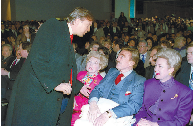
טראמפ עם הוריו ואחותו באטלנטיק סיטי, ב־1990

ב-2004 הורעלה עיתונאית האופוזיציה אנה פוליטקובס"קיה בטיסה פנימית של חברת התעופה "קאראט". פוליטקוב"סקיה סיפרה שהיא שתתה כוס תה לפני שחשה ברע, אך שרדה. אבל כעבור שנתיים היא נורתה ונהרגה במעלית בבניין מגוריה של קווליד.