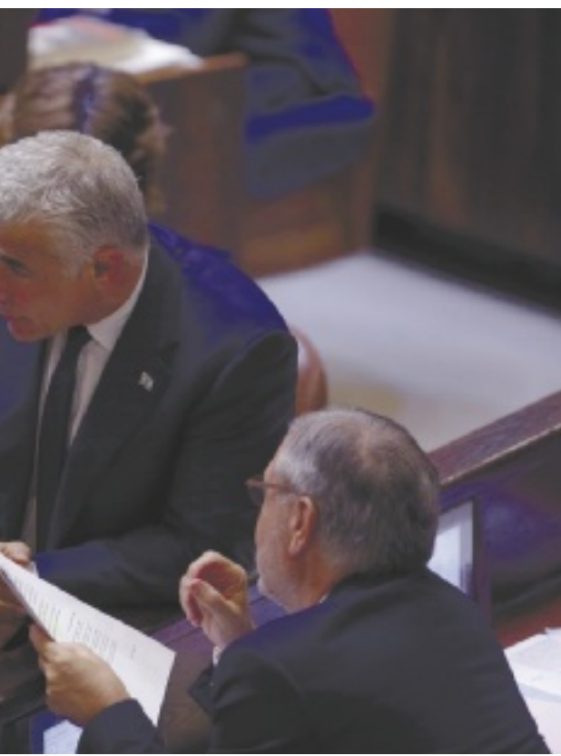
לפיד וחברי סיעתו במליאת הכנסת, אתמול. מודורו בעצם בחוק של יש עתיד", כתב בסוף השבוע

נתניהו הגן אתמול על החוק בישיבת סיעת הליכוד ואמר: "זה חוק טוב ומאוזן. הכוונה היא לט' פל בשוויון בנטל. הנטל הרא' שון הוא נטל כלכלי עצום. ליש' ראל יש נטל תקציבי אדיר תקציב הביטחון הכולל שלנו הוא בערך