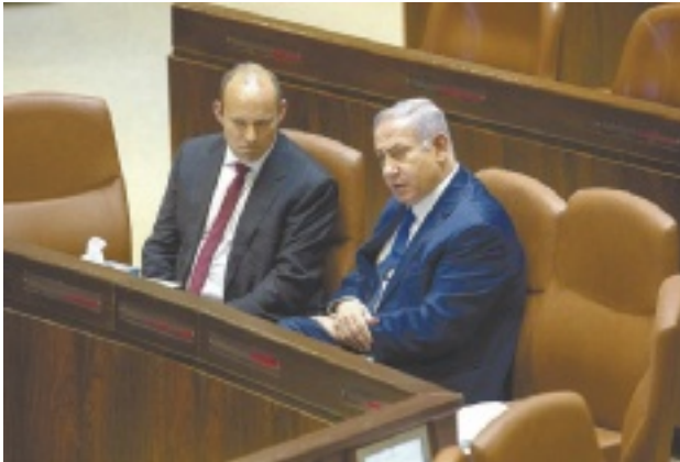
נתניהו ובנט במליאת הכנסת, במארוס