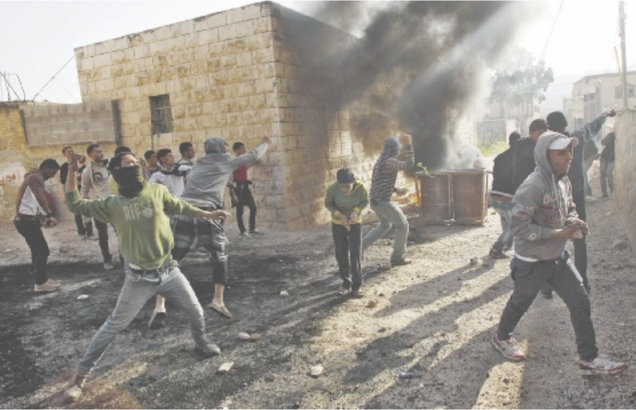
יידידי האבנים בכפר טמון, אתמול