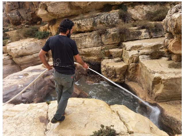
עובדי רטייג בפעולות ניקוי ושיקום הנחל.

בברכה, שׁיי טולקין מרכז שפכים, מים ונחלים