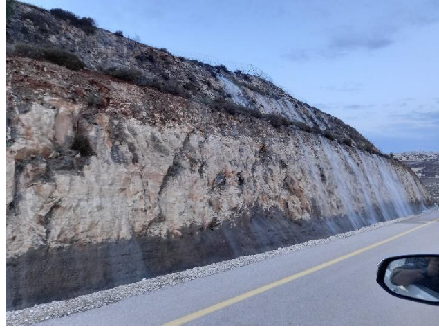
גלישת הביוב לכיוון הנחל.