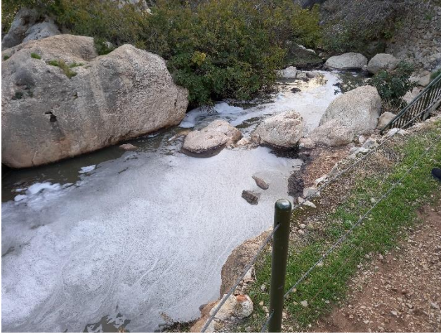
הביוב זורם בשמורת נחל פרת.