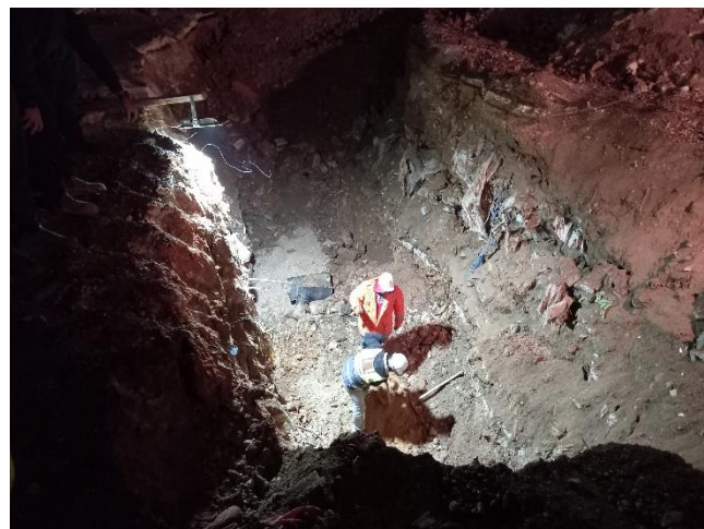
העבודות לחשיפת הקו. ניתן לראות את פרופיל הפסולת בחפירה.