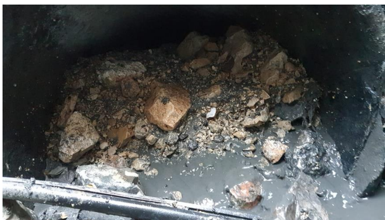
תמונות של הצטברות סחף ואבנים בתוך קו הביוב.