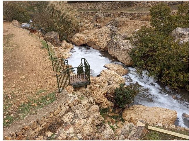
ביוב זורם בשמורת נחל פרת.