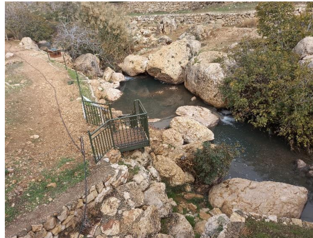
זרימות המים בשמורה.