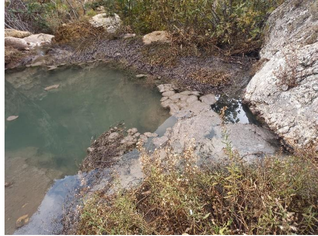
בוצה וצופת בנחל.