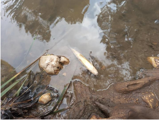
דג מת בנחל.